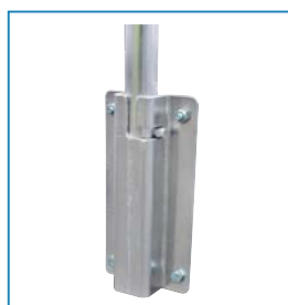
Pot Artikelnr. 42020