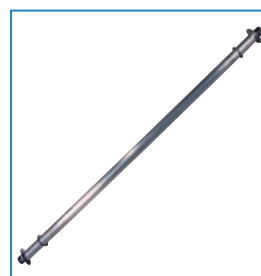
As Artikelnr. 42021