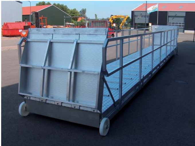
Speciaal: klep ingeklapt