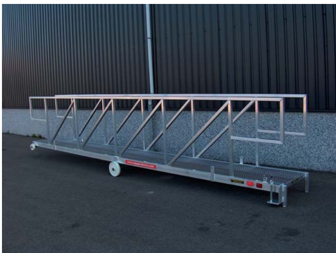
Speciaal: gangway met speciale vaste leuning