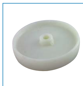
Gangway wiel, ø 25 cm. Artikelnr. 42018