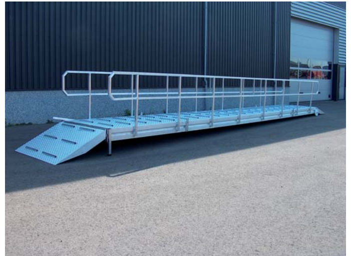
Speciaal: gangway t.b.v. rolstoelen