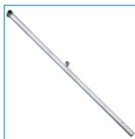
Scepter Artikelnr. 42019