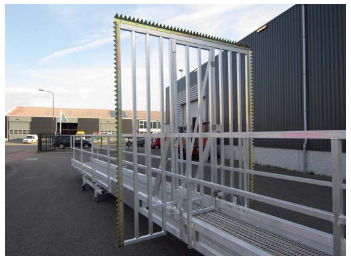
Speciaal: deur t.b.v. gangway (demontabel)